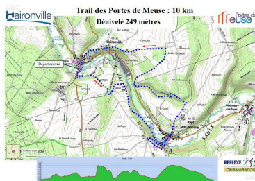
Tracé du 10 km.

Bien que la discipline commençait à prendre d'ampleur, ce marathon couçu par équipes et en relais a connu avec le Covid un gros coup de frein. Si bien qu'à l'occasion des championnats de France, programmés ce week-end, seul le club d'AC Gondreville/Villey saint-Etienne représentera la lorraine, avec tout de même trois équipes en lice. ■